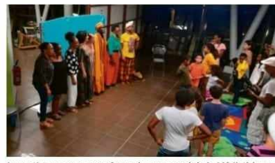
Les artistes accompagnés par le personnel de la Médiathèque à la fin du spectacle.

France-Antilles Martinique • 23 octobre 2024